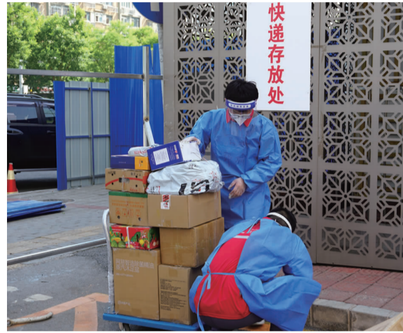
连夜拼装 给快递找个“临时家”

“双井街道此次有6个社区被划入临时管控区,居民们的生物物资保障就成了最大的难点。”双井街道工作人员说道。“通过前期检查和走访,我们发现,每天中午或傍晚,一些小路口口的快递、外卖派送比较集中。”为了保障居民