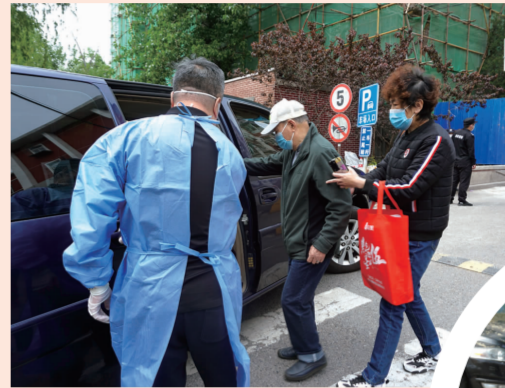
居民乘坐就医直通车