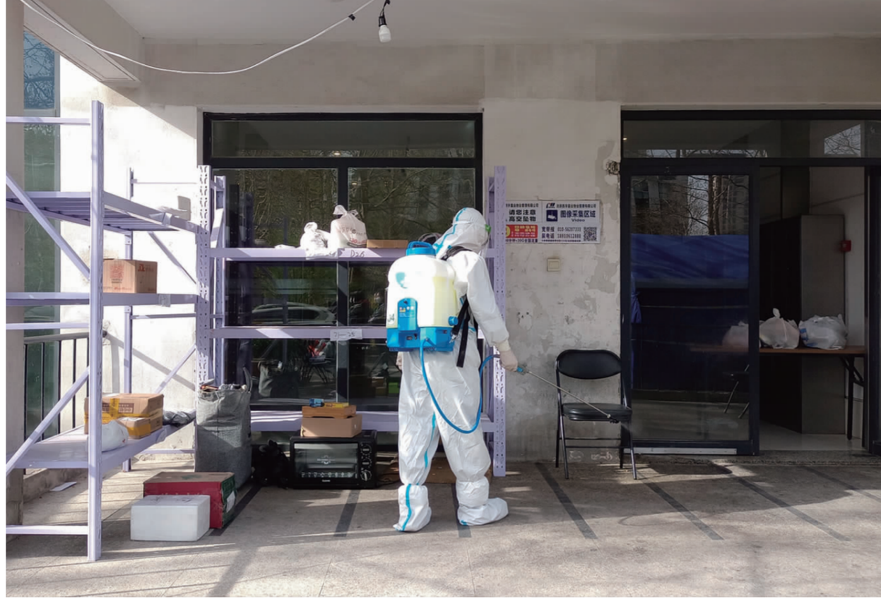
工作人员为快递存放区消杀

当问及夫妇二人是否有所顾虑时,他们答道:“做好个人防护,自己放心居民也安心。”快递进站后,从分拣到装车都会进行消杀。二人送件过程中,都会始终按照规定佩戴手套及N95口罩,每天一次的抗原抗体检测和核酸检测,二人更是从未缺席。