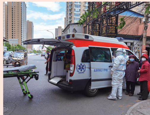
医疗保障组协助医院转运居民